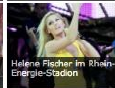
Helene Fischer im Rhein-Energie-Stadion