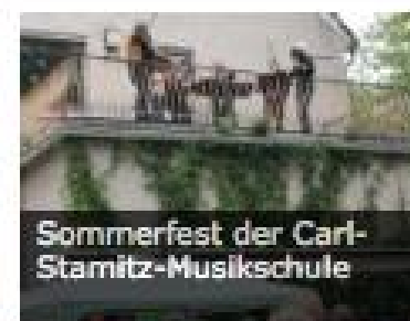
Sommerfest der Carl-Stamitz-Musikschule