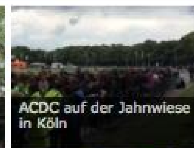
ACDC auf der Jahnwiese in Köln