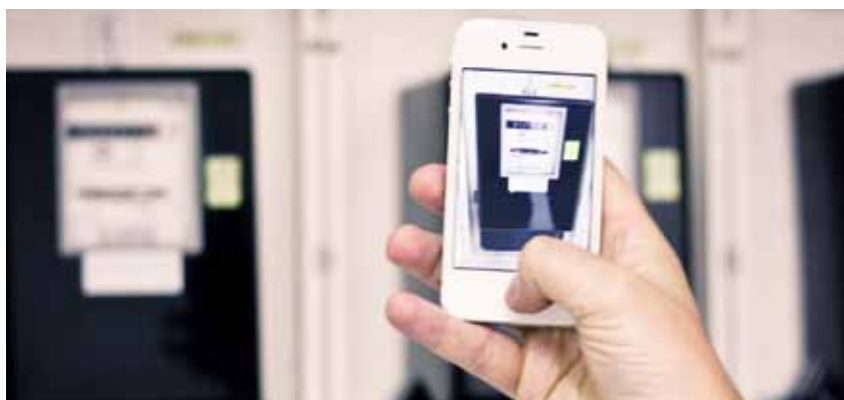
Bild 1. Die Zählerstände werden mit der Kamera des Smartphones oder Tablets eingescannt. Dabei werden die Ziffern mit OCR automatisch erkannt.

Jeder, der sich mit Energie- und Immobilienmanagement beschäftigt, kennt das: Energieverbrauchswerte von Strom, Gas