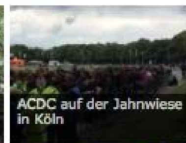
ACDC auf der Jahnwiese in Köln