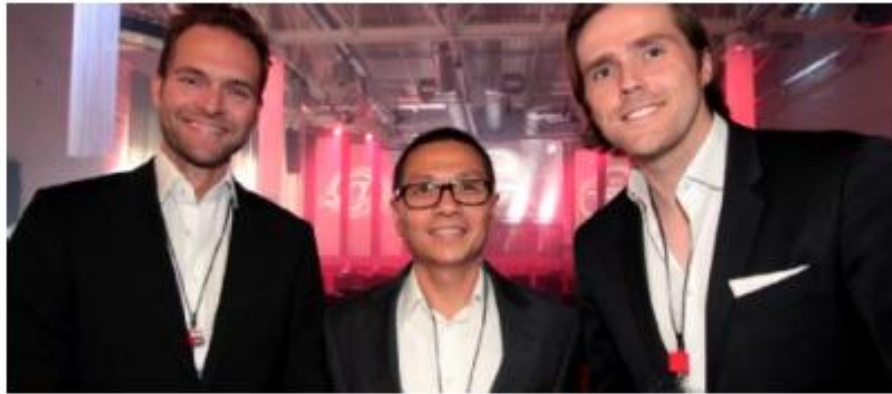
Mitarbeiter der Kölner "picanova" GmbH freuen sich über den NRW-Preis

Das Kölner Unternehmen Ampido hat sich bei den deutschen Internet Awards als bestes Start-Up durchgesetzt. Auch den Sonderpreis des Landes NRW konnte ein Kölner Betrieb mit nach Hause nehmen – ein heimlicher Weltmarktführer.