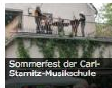
Sommerfest der Carl-Stamitz-Musikschule