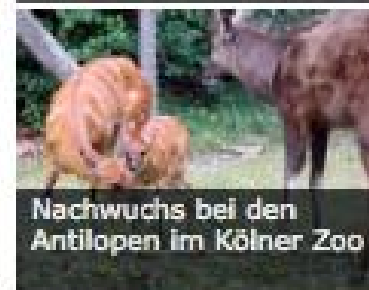
Nachwuchs bei den Antilopen im Kölner Zoo