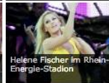
Helene Fischer im Rhein-Energie-Stadion